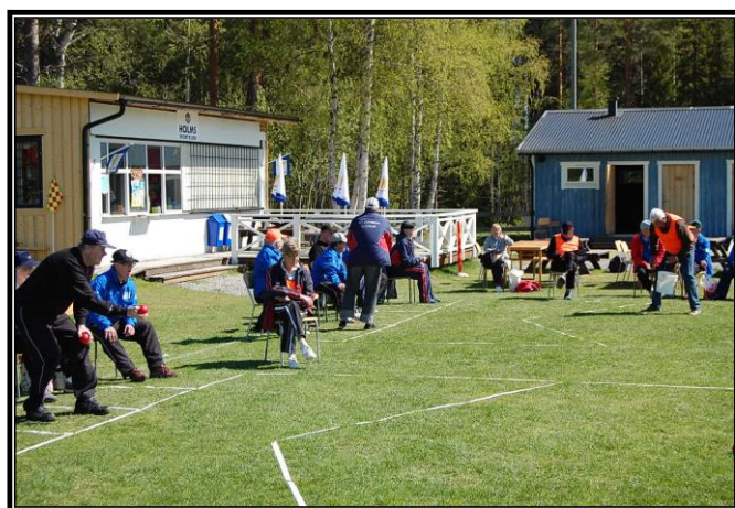
DM utomhusboccia på Holmvallen