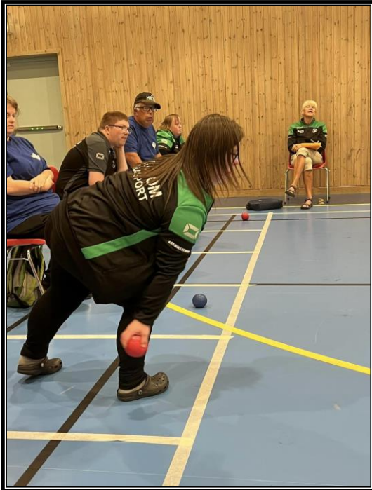
Bocciatävling i Krokomb