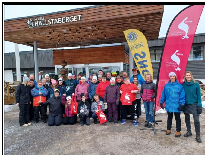
Vinterläger i Sollefteå