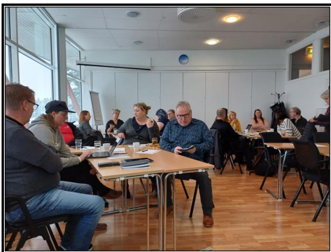
Föreningskonferens Hotell Höga Kusten