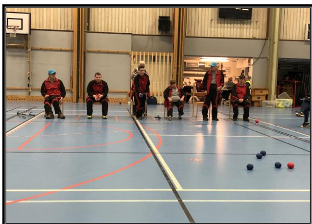
DM inomhusboccia i Fränsta sporthall